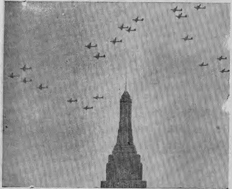
En un simulacro de ataque aéreo en masa contra la ciudad de Nueva York, las superfortalezas, del ejército americano se dan cita sobre la inmensa cúspide del Empire State Building. Nuestros lectores pueden apreciar el inmenso número de fortalezas que tomaron parte en el simulacro de ataque.