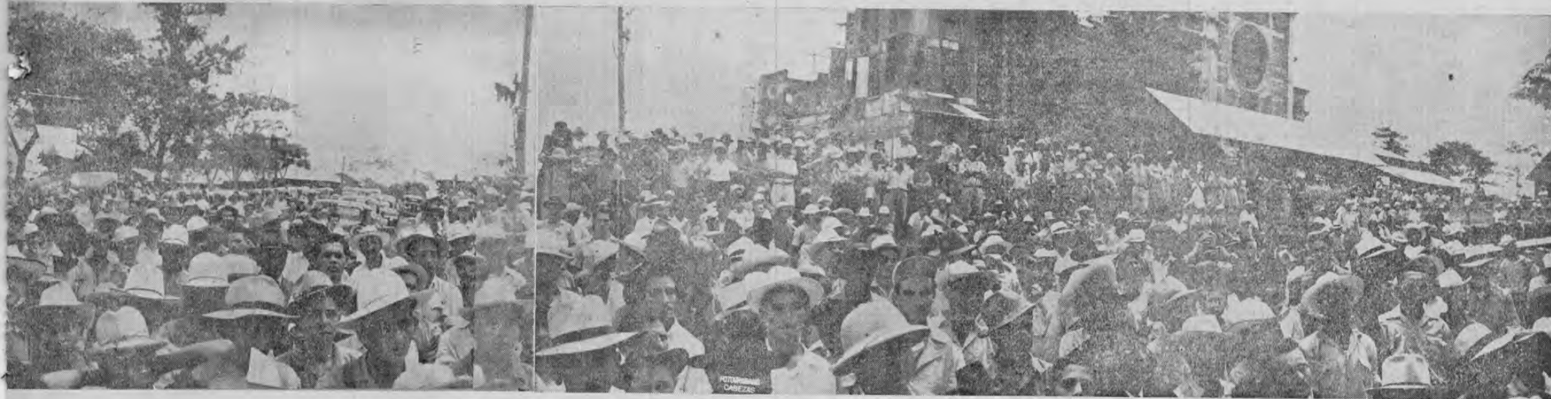
Miles de puriscaleños aclamaron al próximo Presidente de Costa Rica doctor Calderón Guardia

...ON IMPROVISADA EN GUAYABO—HAN SIDO TOMADAS EN DIVERSAS FORMAS: CON LA MAQUINA EN ALTO, CON LA MAQUINA EN BAJO. — LO QUE GENTE LAS FOTOS TIENEN QUE RESULTAR MUY BUENAS. Y AQUI ESTAN LAS FOTOGRAFIAS QUE SON REVELADORAS