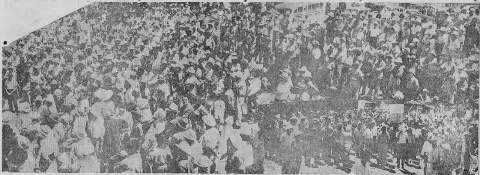
En el Diario de Ulate, se nos viene diciendo que nuestras fotos son "trucos" porque no son tomadas desde lo alto. Aquí tienen esas pobres gentes la multitud calderonista reunida el domingo en Puriscal aclamando al Dr. Calderón Guardia. Esta panorámica fue tomada desde un segundo piso y puede ofrecerse, en toda su magnitud la grandiosidad de aquella imponente reunión que ha puesto el pavor en las raquíticas filas ulatistas de Puriscal.

Aquí tienen una magnífica foto de la multitud puriscaleña reunida frente a la tribuna calderonista aclamando al próximo Presidente de la República, Dr. Calderón Guardia